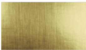
M19 Gold Aluminium