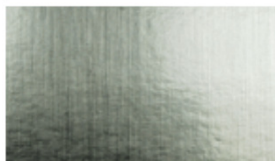
M015 Champagne Aluminium