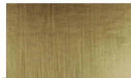
M022 Gold Chrome