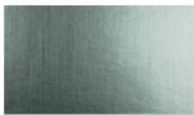
M012 Silver Aluminium