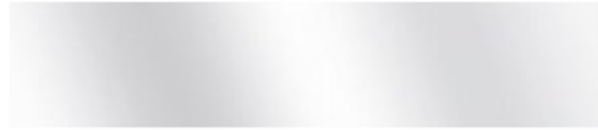
M057 Mirror Aluminium Silver - ProFoil